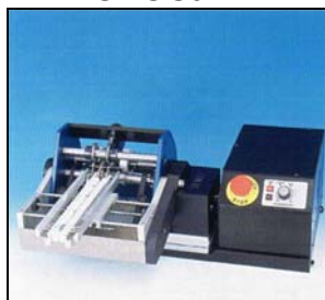
TP6/PR-B с приводом MOT98 и фидером CS10