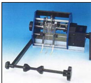
TP6/PR-B с держателем BR6