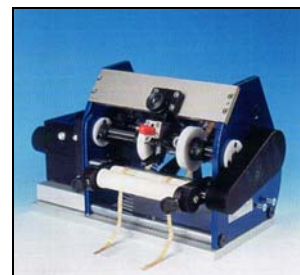
Вид сзади TP6/PR-B с эджектором TNS